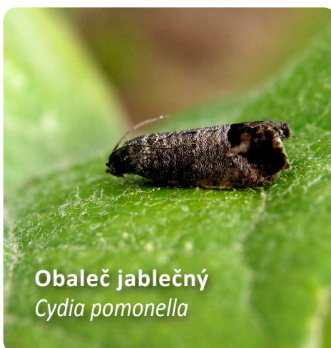
Obaleč jablečný Cydia pomonella

I Feromonové matení je založeno na principu odparu samičích feromonů do prostředí sadu, čímž je znemožněno samci najít samici k páření a založení příští generace.